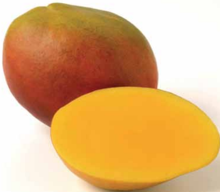
O caroço da manga pode virar plástico