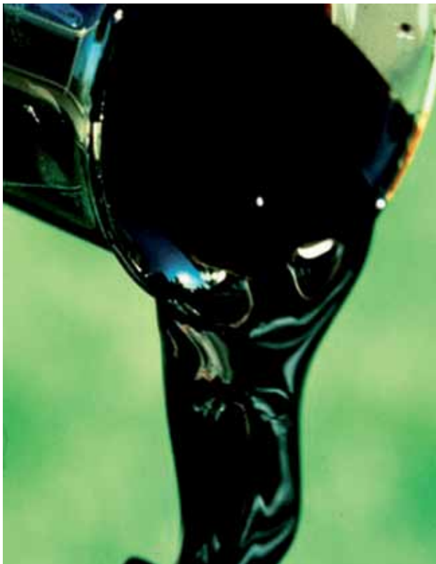
Petróleo pode ser substituído também na fabricação do plástico

xos saturados e isenta de ácidos graxos trans, desenvolvida na Faculdade de Engenharia de Alimentos da Universidade Estadual de Campinas (Unicamp). Em parceria com a Cargill Agrícola, garantiu à universidade uma arrecadação recorde de royalties de R$ 724 mil em 2011. O produto é utilizado como recheio de biscoitos, dentre outras aplicações. As pesquisas foram iniciadas na década de 1990, mas somente em 2008 os resultados começaram a aparecer e chamaram a atenção da indústria.