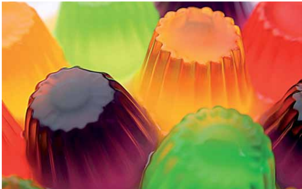
Existem pesquisas também em relação à gelatina

O projeto surgiu da necessidade da empresa Corn Products Brasil de ampliar as aplicações de um plástico biodegradável conhecido como Ecobras, que já está no mercado, desenvolvido