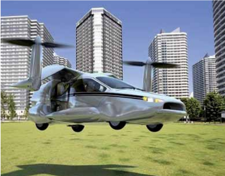
Empresa prevê que TF-X estará à venda em 2025