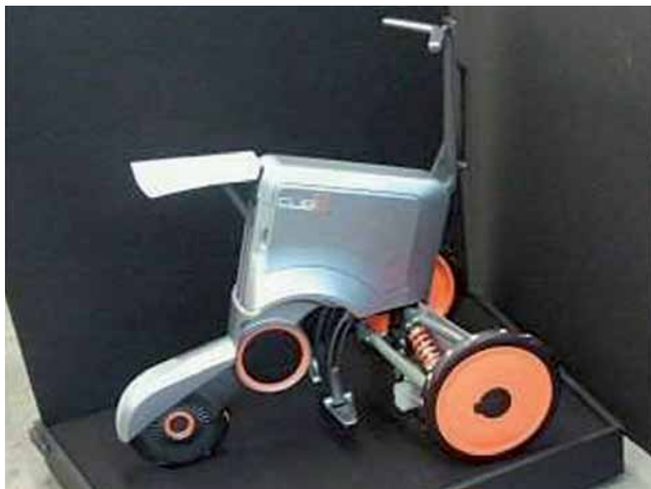
Triciclo dobrável é apresentado por alunos da Poli-USP e mais três universidades estrangeiras.

Um museu dos menos visitados em Londres conta a história do pioneirismo inglês no transporte público. Veja o site, em português: mapadelondres.org/2011/05/museu-do-transporte-de-londres/