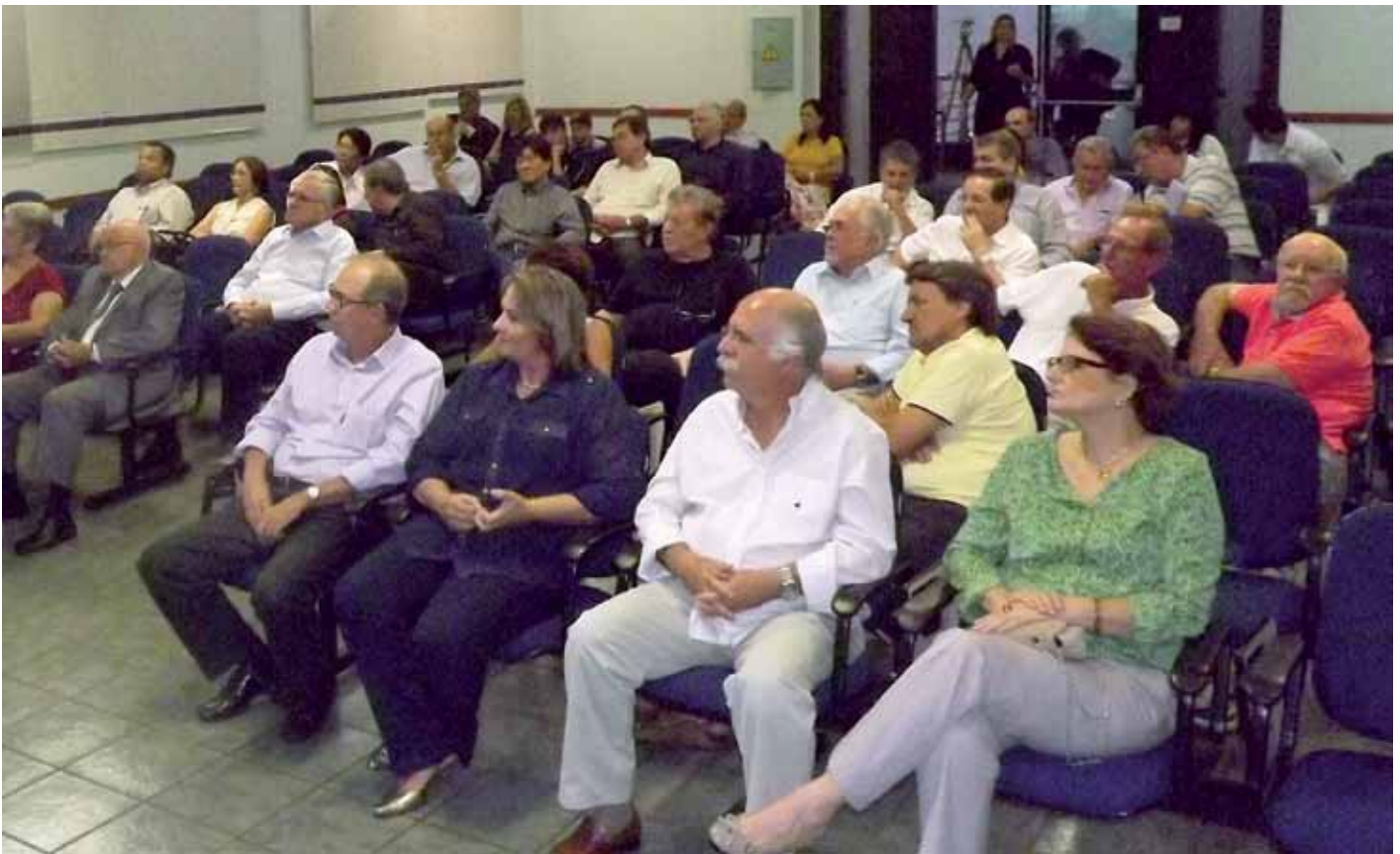
Familiares e amigos prestaram homenagens aos associados que dão nome às salas na AEAARP

Salas do pavimento da sede da AEAARP receberam seus nomes