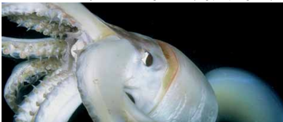
Em Cingapura, testes usam tentáculos de lula para produzir bioplástico

Uma equipe da Universidade Tecnológica de Nanyang (NTU) e Agência para