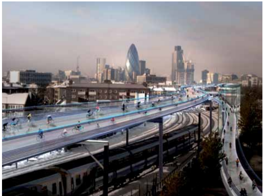
SkyCycle terá aproximadamente 220 quilômetros de extensão para circulação dos ciclistas em Londres.

Novidades tecnológicas e projetos curiosos prometem diminuir o funil formado pelo grande volume de carros que circulam nas maiores cidades do mundo