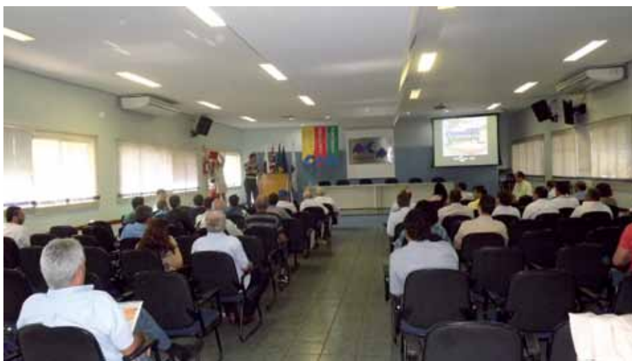
Caravana Embrapa foi realizada na AEAARP

tem sido a recomendação da Caravana Embrapa de Alerta às Ameaças Fitossanitárias, para enfrentar a praga e tem como âncora o controle biológico, cultural e químico, que só deve ser utilizado em último caso.