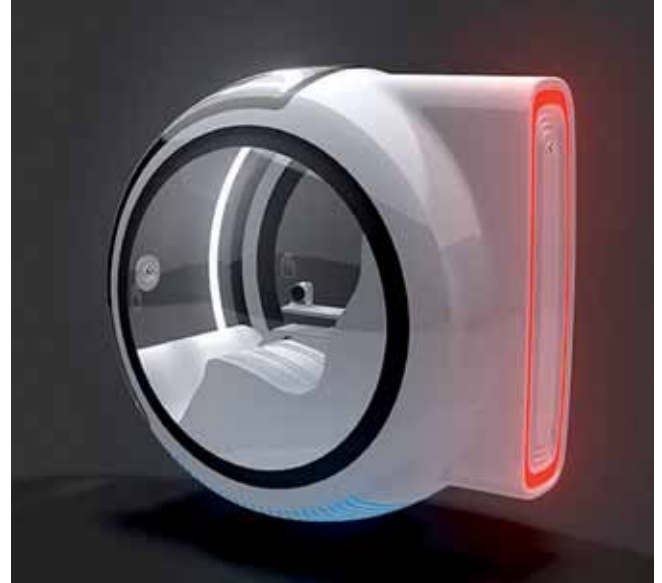
Houver Car é o modelo futurista de carro equipado com um avançado sistema de prevenção de colisões que avalia a distância entre veículos.

seria três vezes mais rápido. Com motor elétrico movido parcialmente à luz solar, o ônibus chegaria a 60 quilômetros por hora e levaria até 300 pessoas por vagão. O veículo seria dotado de elevador lateral para entrada de passageiros e sistema de parada automático, para ser acionado em situações de emergência.