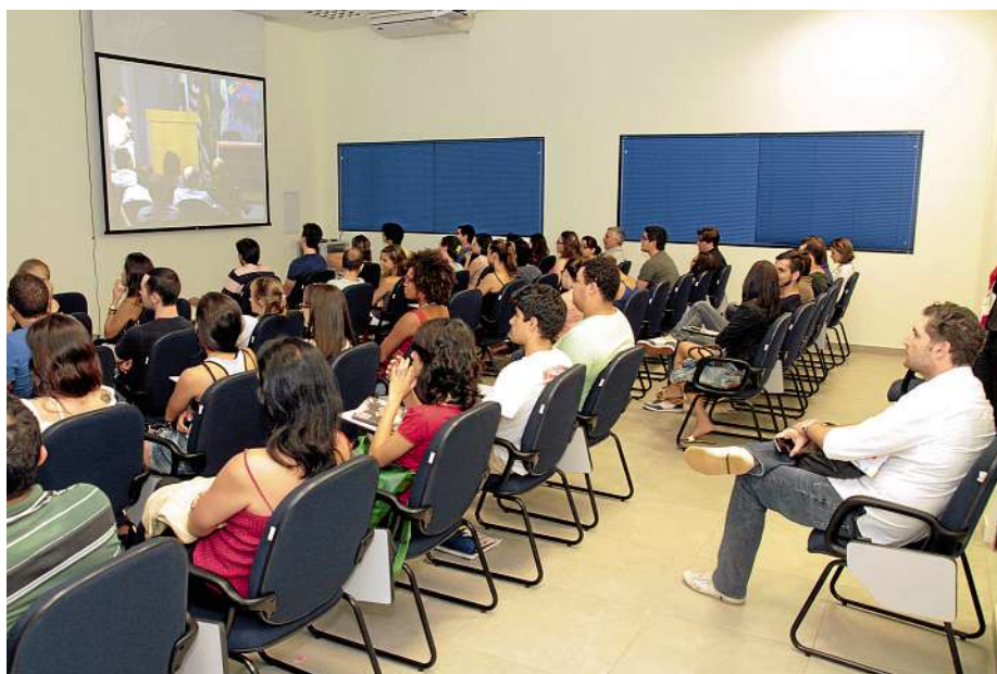
Arquitetura Moderna e seus descendentes foi o tema da 4ª semana de Arquitetura da AEARP

Para os estudantes, deixou um conselho: “Esqueçam o eu gosto ou não gosto, é bonito ou é feio. Temos que ter caráter objetivo e técnica”, disse. “A arquitetura é a arte construída, mas é preciso saber de técnica de construção e história da arte, senão você não é um arquiteto”.