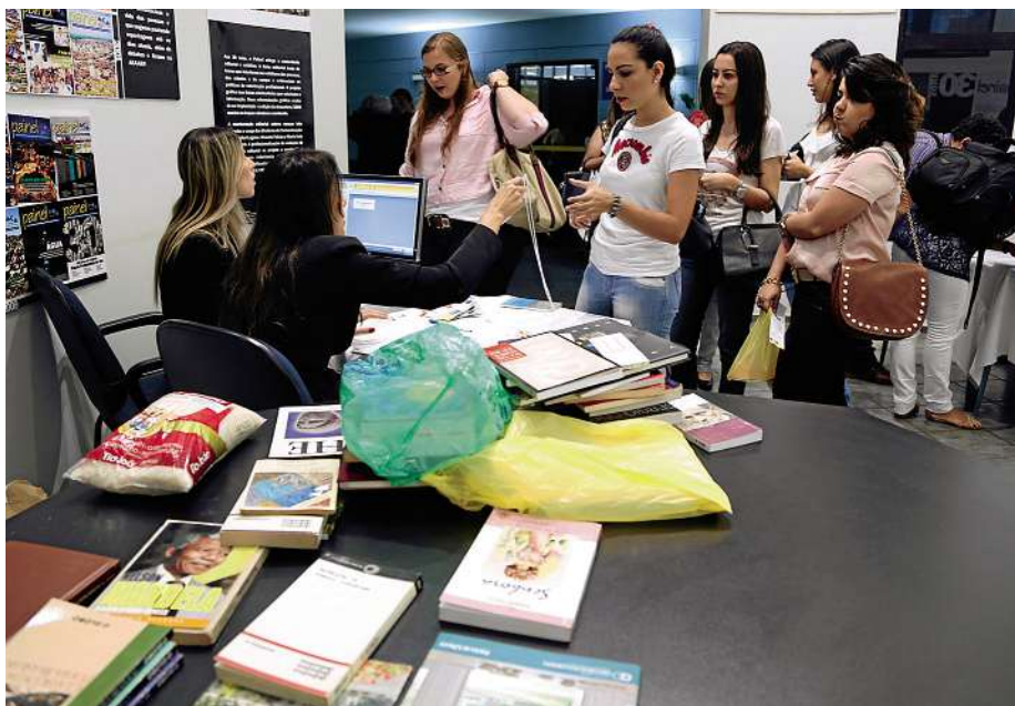
Inscritos na 4ª Semana de Arquitetura doam livros para biblioteca da AEAARP

O projeto de Bucci propõe transformar o museu em uma espécie de corredor suspenso, com três quilômetros de comprimento, que passaria sobre o parque do Ibirapuera. O museu seria uma única galeria com 10 metros de altura por 10 metros de largura, com piso transparente, permitindo ao visitante observar o parque enquanto visita o museu e, a quem visita o parque, acompanhar o movimento interno do local. Para ele, o museu deveria abrigar dois mezaninos: um para o escritório administrativo e outro que