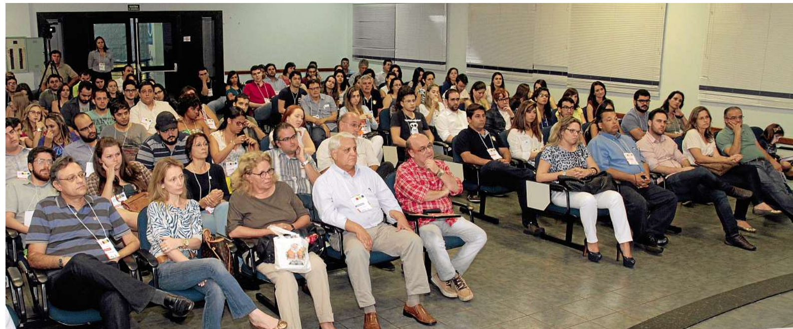
4ª Semana de Arquitetura da AEAARP realizada entre os dias 21 e 26 de outubro